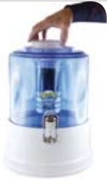
5. KALKFILTER: in den Kartuschen Hänger legen

Wichtig: Filtern Sie das Wasser nur unter Aufsicht. Wenn Sie zu viel (max. 8 Liter) Wasser ein- füllen, kann das Gerät über den Trinkwasser- behälter auslaufen.