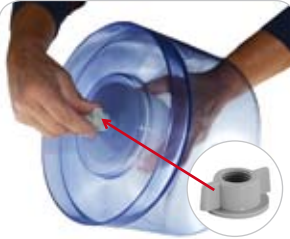
8. Flügelmutter: auf der Filter-Schraube fest schrauben

Wichtig: Filtern Sie das Wasser nur unter Aufsicht. Wenn Sie zu viel (max. 8 Liter) Wasser ein- füllen, kann das Gerät über den Trinkwasser- behälter auslaufen.