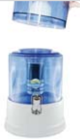
9. OBEREN TANK: aufsetzen