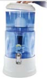
10. DECKEL: aufsetzen

Wichtig: Verwenden Sie grund- sätzlich Trinkwasser bzw. Leitungswasser, welches für den menschlichen Genuss geeignet und zugelas- sen ist.