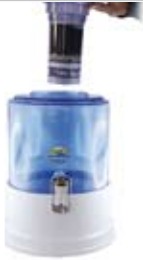
4. FILTERKARTUSCHE: in den Glasbehälter einhängen