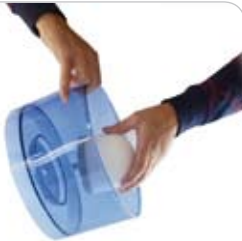
6. KERAMIKFILTER: im oberen Tank von innen einstecken