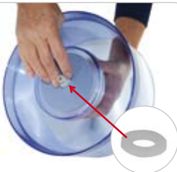
7. DICHTUNGSRING: auf der Unterseite des Tanks auf die Filter-Schraube aufschieben

Wichtig: Verwenden Sie grund- sätzlich Trinkwasser bzw. Leitungswasser, welches für den menschlichen Genuss geeignet und zugelas- sen ist.